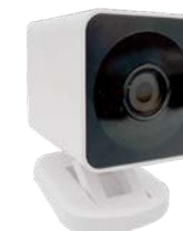
Smart kamera F-CAM 20206013