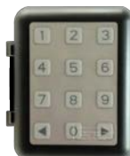
Bezdrátová klávesnice WK01/868 2-kanál 868MHz