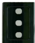
Bezdrátová klávesnice WWS01/868 3-kanál 868MHz