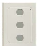
Bezdrátová klávesnice WWS01 3-kanál 433MHz