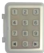
Bezdrátová klávesnice WK01 2-kanál 433MHz