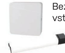
Bezdrátové jištění vstupních dveří SD02