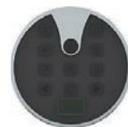
Bezdrátová klávesnice s elektronickým klíčem WK02 2-kanál 433MHz