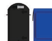
Záložní baterie BB04