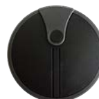
Bezdrátové tlačítko WWS03/868 2-kanál 868MHz